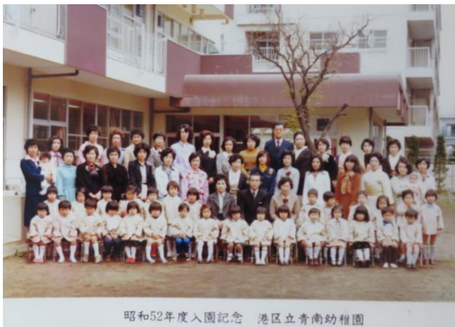
昭和52年度入園記念 港区立青南幼稚園