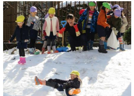
園庭がすてきなスキー場に変身!