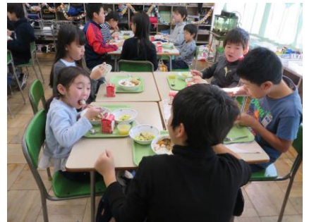
5年生と一緒においしいカレーをいただきました