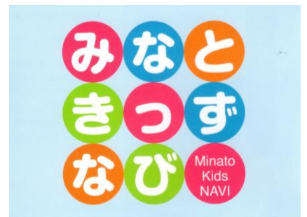
家のどこかに貼って、親子で再確認してみましょう