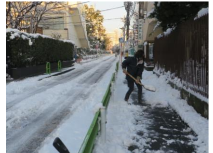
みんなの安全のために職員総出で雪かき

改めて、年度初めにお渡しした『みなときっずなび』を親子で見直して、生活の基本を再確認していきましょう。