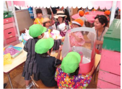
かえで組はグループで出し物を考えます

また、昨年ご紹介した幼稚園近くのマンションの軒には、今年もツバメが巣を作って卵を温めている様子が見られます。南青山の豊かな自然を再発見し、日々の遊びや生活を豊かにしていきたいと思います。