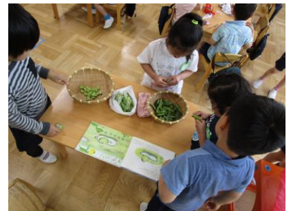
ソラマメはふわふわのベッドに入っていたよ