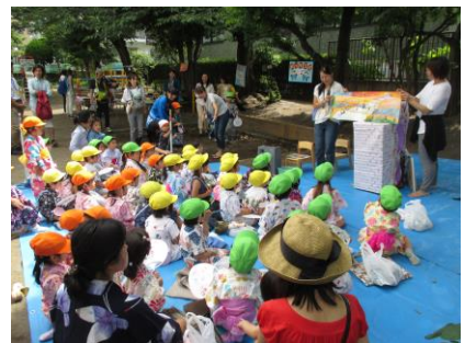
保護者の皆さんの出し物も多彩です