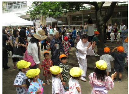
盆踊りをみんなで一緒に踊って楽しめます