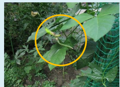
畑のササゲは網を伝わって伸びて花を咲かせ小さなササゲが実りました