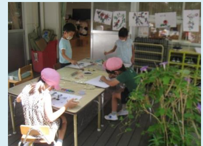
年長児は絵心をくすぐられ竹の筆で小さな画伯になっています