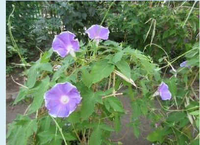
プランターのアサガオは竹の支柱にからんできれいに咲きました

柔らかく白い綿は、内側からの力によって柎を開いて姿を現します。虫や自然を好きになるかどうかは、外から強制的にできるものではありません。子どもを綿に例えれば、園が安心して自分を出せる場になり、目の前の環境に興味を示して自分から関わっていった（殻が開きかけた）ときに、周りの大人がそこでの出会いを心に残るものにするひと言を掛けられたらすてきですね。