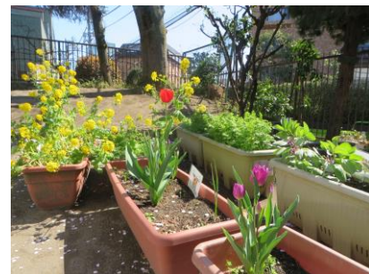
いろいろな花が入園進級を祝っています