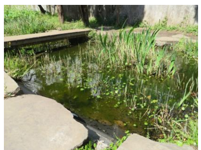
わくわく池にはオタマジャクシがいっぱい！