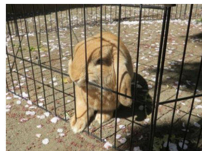
みみくんも、みんなが来るのを待っています