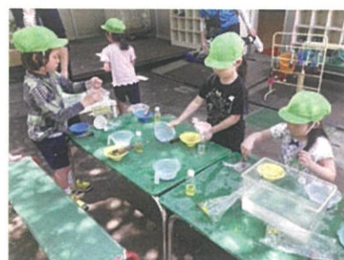
自然物を使った色水遊びでは、草花を使って様々な色を作ります。