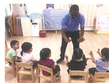
幼稚園ネイティブティーチャーとの関わりを楽しみながら、外国の言葉や文化に触れています。