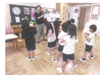
サポート保育の中で元保護者による「英語で遊ぼう」。楽しく英語に触れながら活動します。