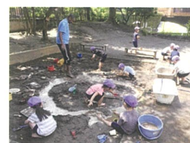
砂場では水を使って遊び、試したり、気付いたり、発見したりしています。

国際理解教育を推進し、自国や他国の文化や伝統に触れる経験を通して、国際理解の意識の芽生えを培います。