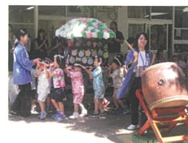
保護者の青南まつりで楽しく遊び、年長児が子ども青南まつりを行います。