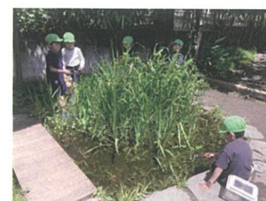
ビオトープにはヤゴやオタマジャクシカエルなど生き物がいっぱいいます。