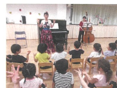
地域の方による七夕コンサートで本物の音に触れます。感性を豊かに育みます。