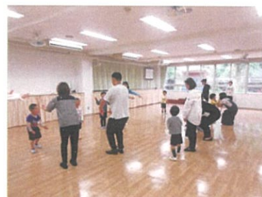
親子触れ合い遊びで、親子や保護者同士の関わりを楽しみます。