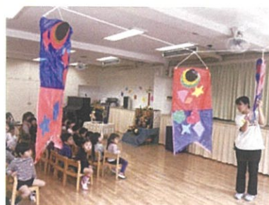
日本の伝統文化に触れる行事を大切にしています。

国際理解教育を推進し、自国や他国の文化や伝統に触れる経験を通して、国際理解の意識の芽生えを培います。